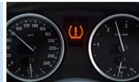
UPOZORNENIE SYSTÉMU TPMS

TPMS je elektronická funkcia navrhnutá na monitorovanie tlaku vzduchu v pneumatike. Systém následne vysiela signál do prijímača vo vozidle. Ak tlak poklesne pod určitú nastavenú hladinu, displej na prístrojovej doske vozidla na túto skutočnosť vodiča upozorní.