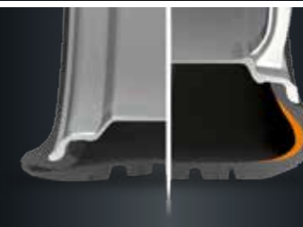
TRADIČNÁ PNEUMATIKA | PNEUMATIKA DRIVEGUARD